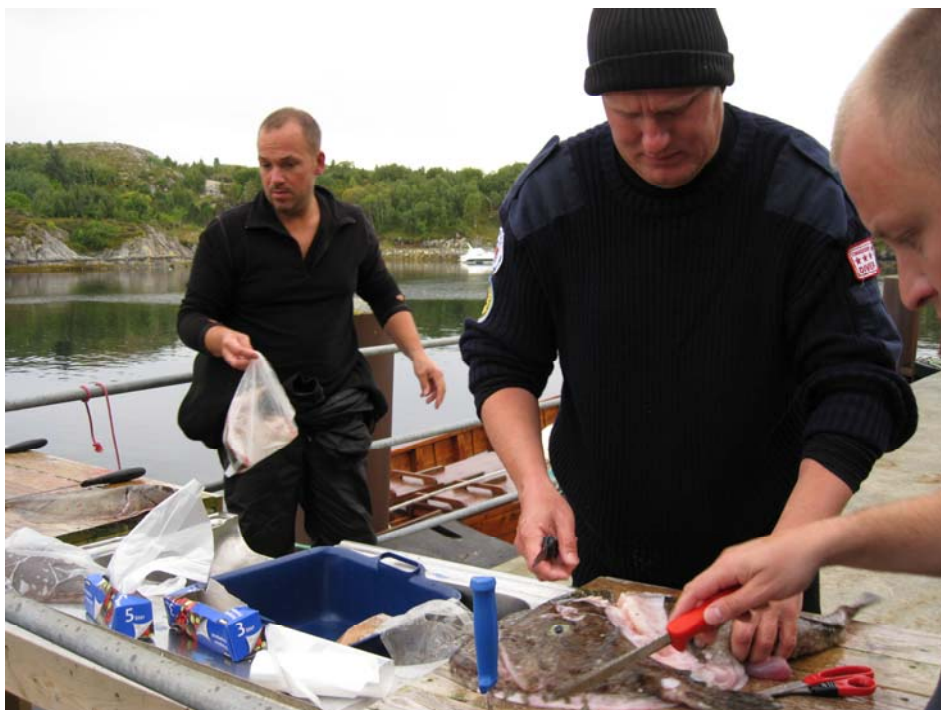
Hitra hösten 2009

Hon var en väldigt ung dotter till en sportdykare och följde med till Norge och badhuset. Jag har sett henne växa upp och hon är jätteduktig i vattnet. Jag skulle vilja höra hur det har varit att växa upp med vatten och hur hennes framtid med vatten ser ut.