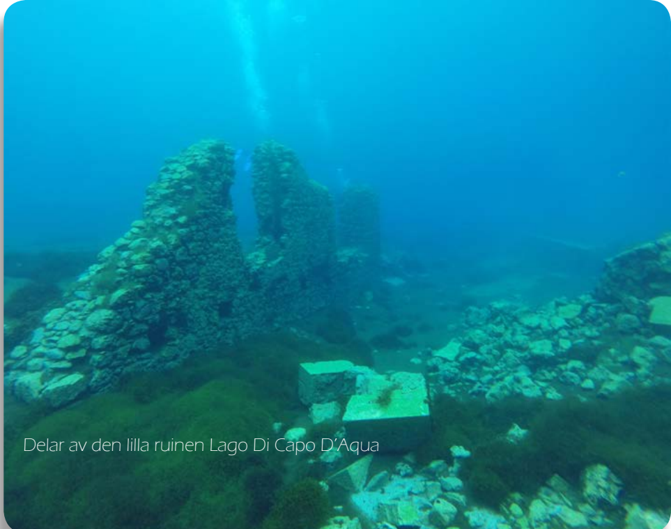
Delar av den lilla ruinen Lago Di Capo D'Aqua